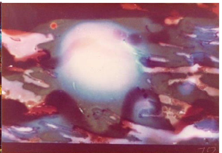
"Mano siela" 1969 m.